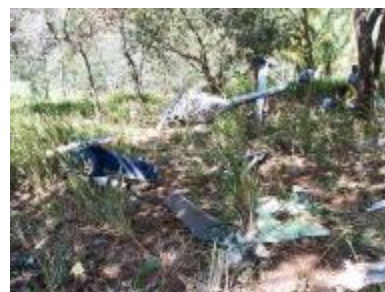
Impactantes vistas de colisiones son mostradas en el video