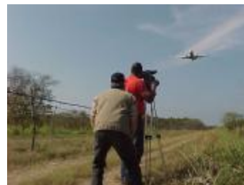
Personal del GECU en plena filmación

“ Peligro Inminente ” es una excelente producción del Grupo Experimental de Cine Universitario (GECU) de la Universidad de Panamá y para la misma se efectuaron filmaciones en diferentes sectores de la República, además de fotografías y entrevistas.